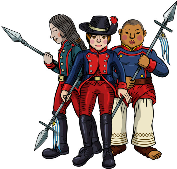
Las Lanceras de Artigas