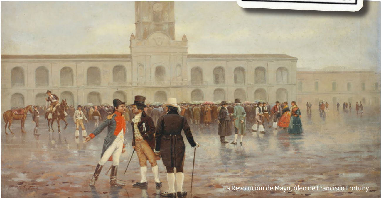
La Revolución de Mayo, óleo de Francisco Fortuny.

Por eso, el 25 de mayo de 1810 se destituyó al virrey Cisneros y se formó la Primera Junta de gobierno. Pero toda esa semana, desde el 18 hubo reuniones a escondidas y un cabildo abierto que empezó a funcionar el 22 de mayo.